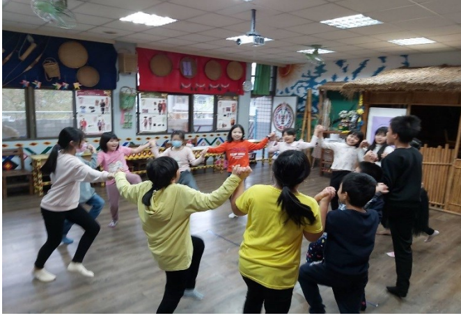
平日文化課程上課剪影