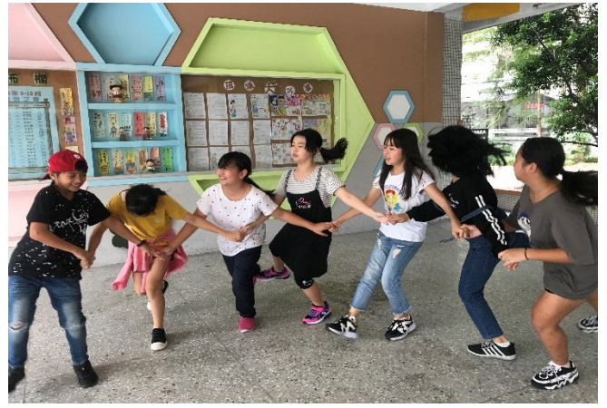
每週六才藝課程練習舞蹈剪影