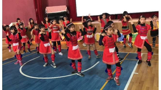
展現平日所學秀給爸媽看