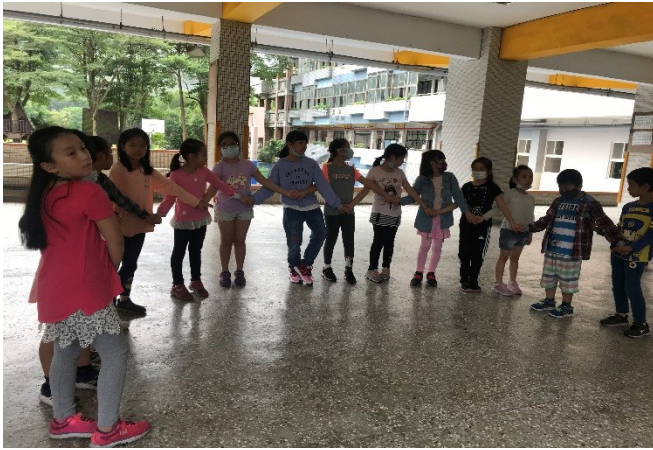
每週二、三文化課程練習剪影