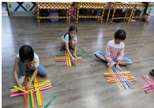
體驗原住民傳統技藝，毛編頭飾及專屬自己的串珠手環，孩子們愛不釋手。