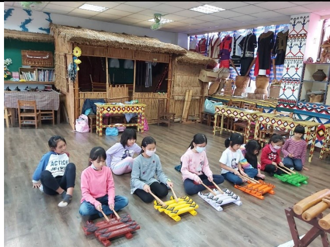
體驗編織、敲擊木琴或跳竹竿舞，他們使用器材完全取之於大自然