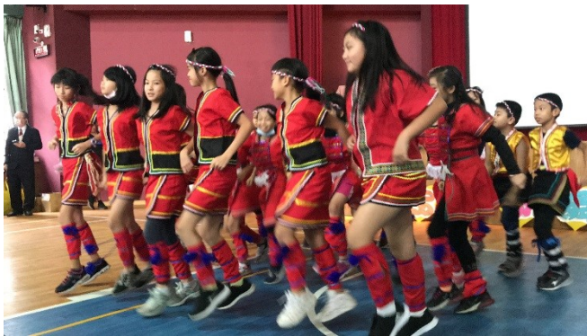
走進部落屋：安排中年級各班學習原住民族文化