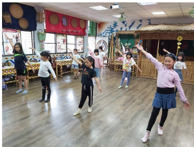
孩子們欣賞不同原住民族的音樂舞蹈特性，開始練習自我展現。