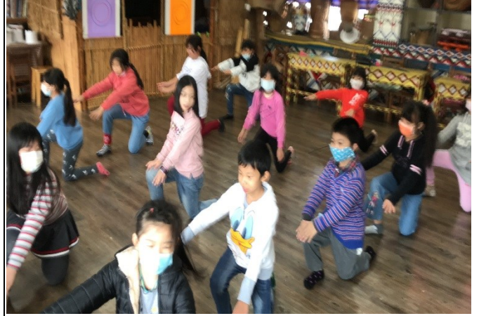
每週二、三文化課程練習剪影