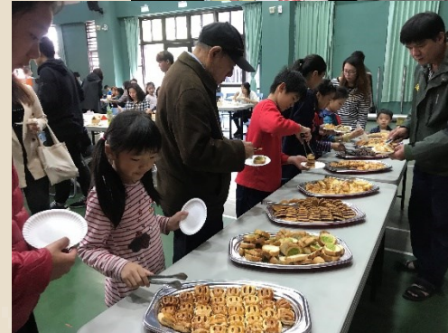
校內歲末成果發表