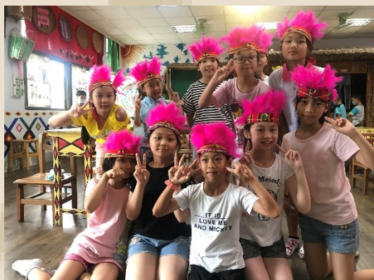
認識體驗原住民的服飾