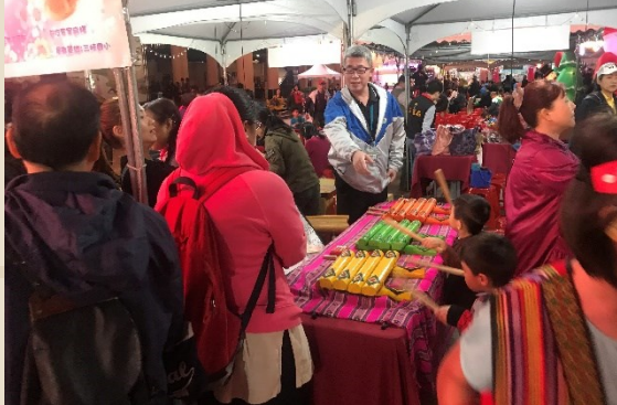
靜態成果木琴演奏體驗

1. 108年11月27日配合市府辦理「靜態成果發表會」 2. 靜態. 闖關活動名稱：層層木音