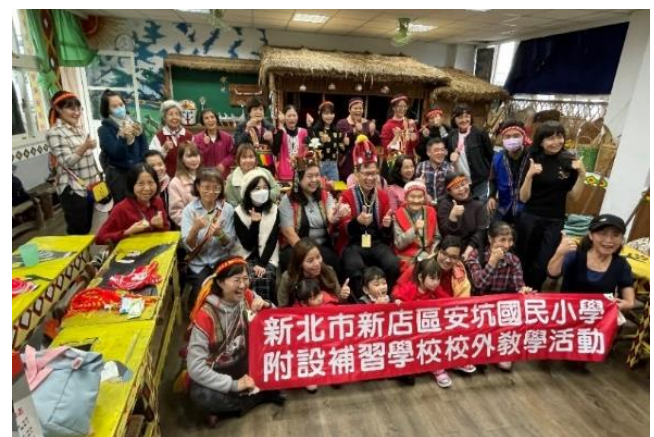
一起體驗射箭，學員合影為收穫滿滿的一天畫下句點