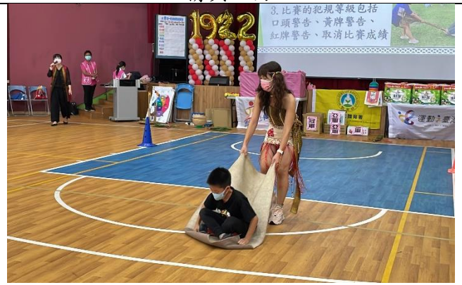
親子進行拖拉接力競賽，培養大家默契