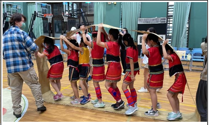
大家齊心合一並展現熱情，小朋友真 得好開心。