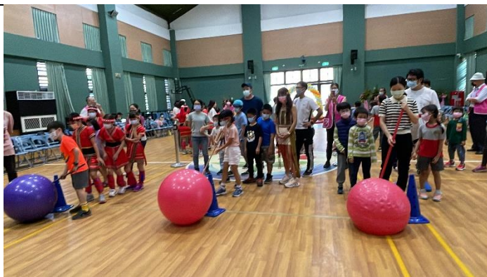
趕山豬接力競賽，親子共同參與。