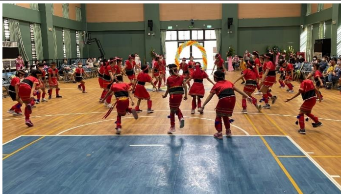
本齣舞曲以熱情為動力，先為校慶祈禱後，轉為同心圓隊形象徵大家齊心合一。