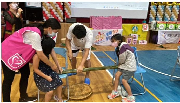
這是很難得的體驗，親子合力一起鋸木