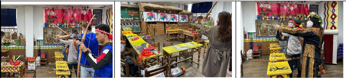
照片說明：利用戲劇讓小朋友認識移工母國多元文化，演員與觀眾互動的畫面，讓孩子很有感