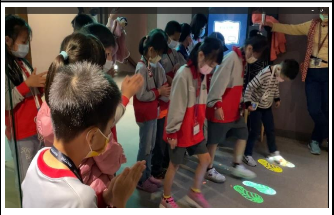
近距離參與導覽解說，觀看 3D 部落電影院、體驗製作原住民風格手工藝，適合家人一起來體驗。