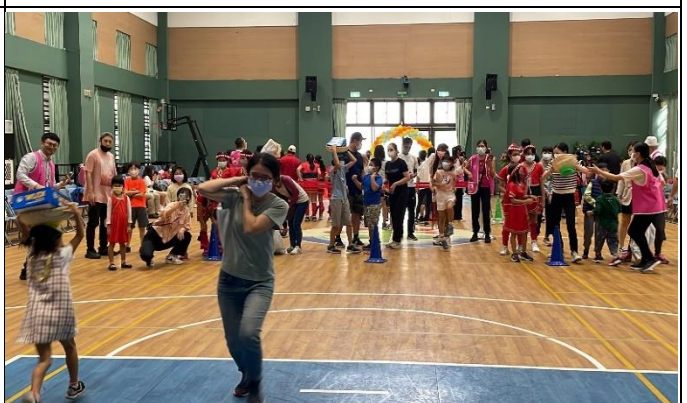
體驗負重，增添親子假日生活趣味多