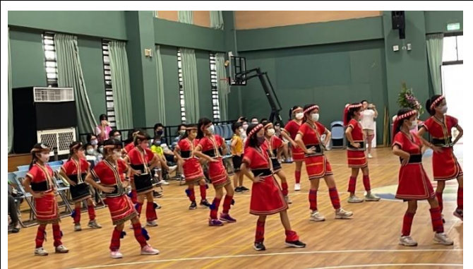
曼妙的舞姿與輕快歡樂的歌聲，展現學子們熱情與活力