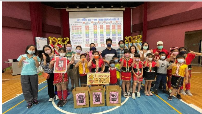
趕山豬接力競賽，親子共同參與。