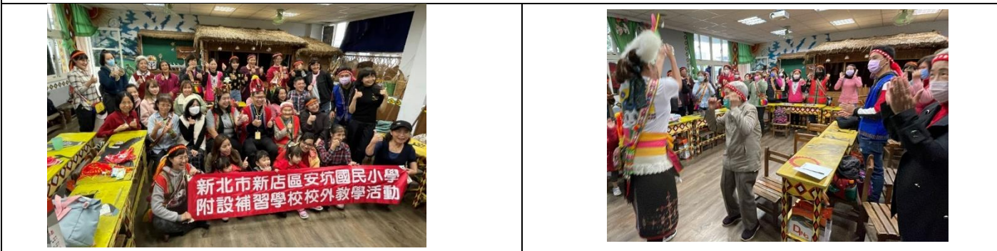
新北市新店區安坑國民小學 附設補習學校校外教學活動