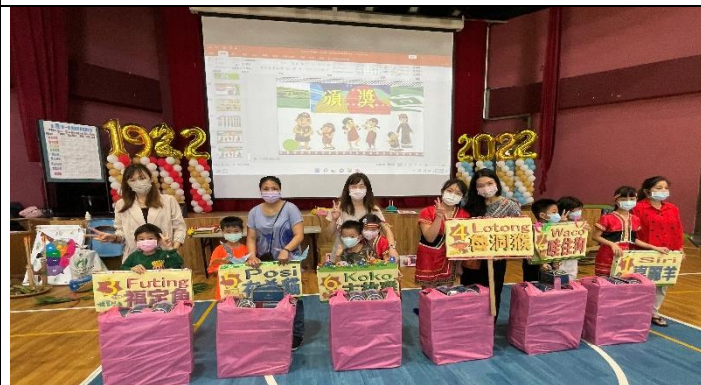
令小朋友及家長應接不暇，現場氣氛 High爆，小朋友滿載而歸！