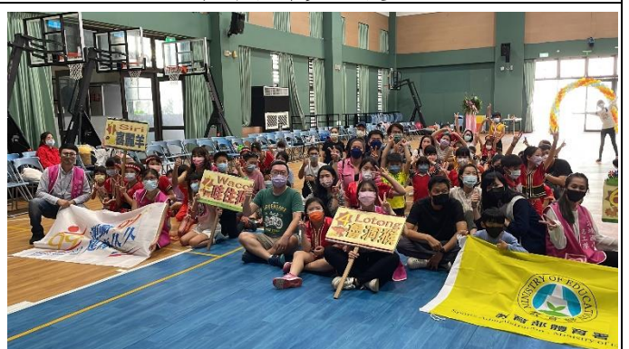
爸爸媽媽大手牽小手，屬於親子活動 的家庭的幸福時光。