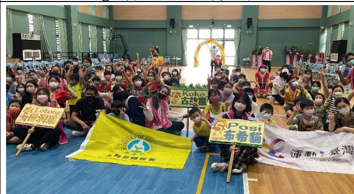
小朋友回饋說喜歡這樣的活動，聽了真是太感動 了。