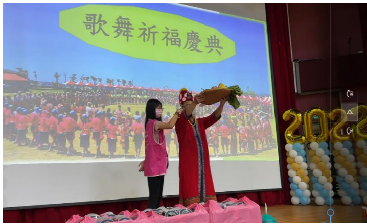
由頂埔教會原住民及傳道帶領全體祈福