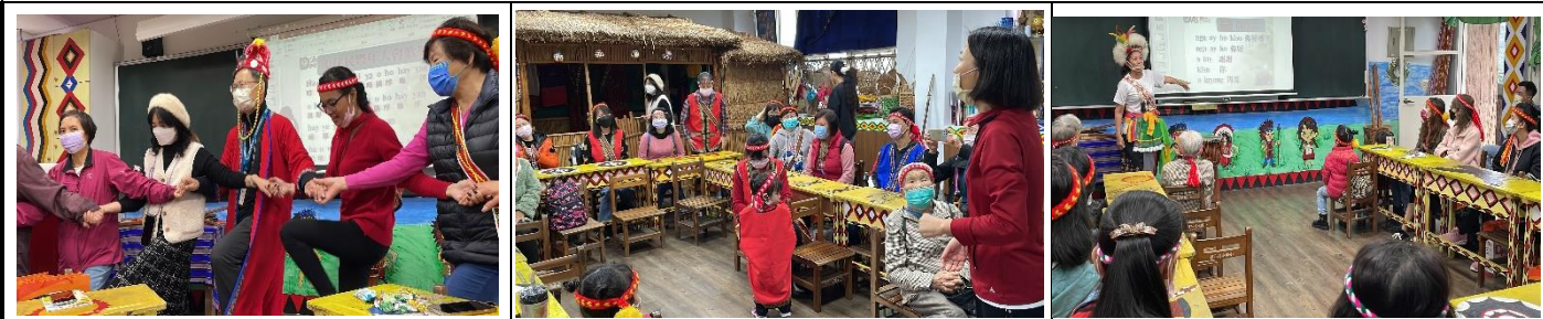
照片說明：為讓學生增廣見聞，了解多元文化，欣賞六藝劇團-移工多元文化。