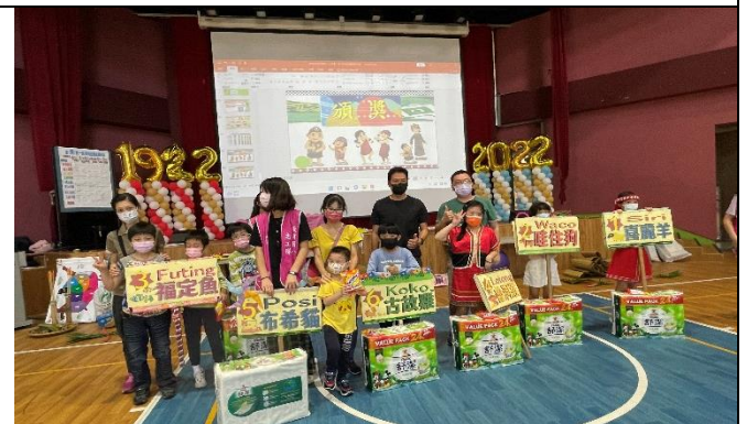
在整個活動和比賽過程中，親子一起 得到了許多收穫。