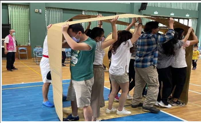
穿山越嶺帶給親子們無限的歡樂。