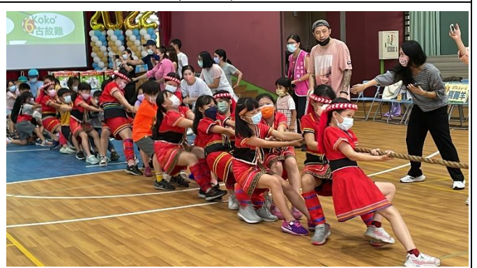
體驗負重，增添親子假日生活趣味多