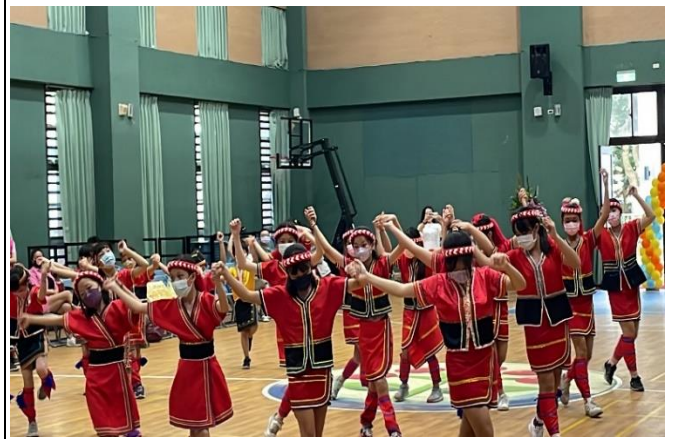
小太陽原音舞蹈社，為這場運動會揭開序幕。