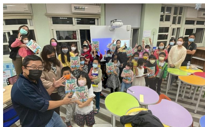
體驗親子書香伴，一個充實又知知性的夜晚。