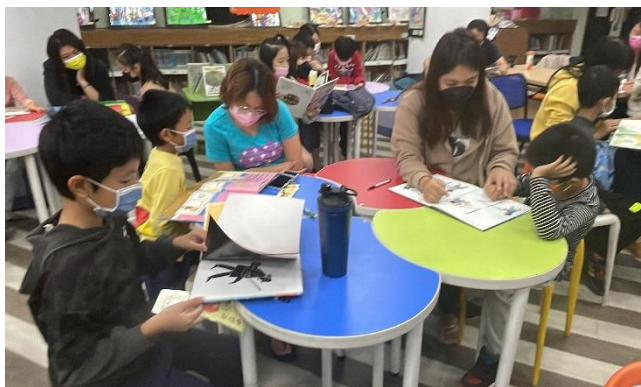
以書本澆灌童年，陪伴孩子快樂成長！