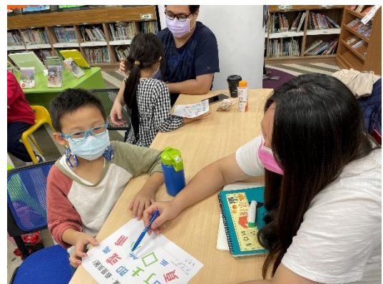
進而介紹『妖怪才不恐怖』，內容非常有趣，不但讓講座過程輕鬆愉快，提出很多思考點很棒，隱藏其中的涵義也頗發人深省，都讓家長獲益匪淺。