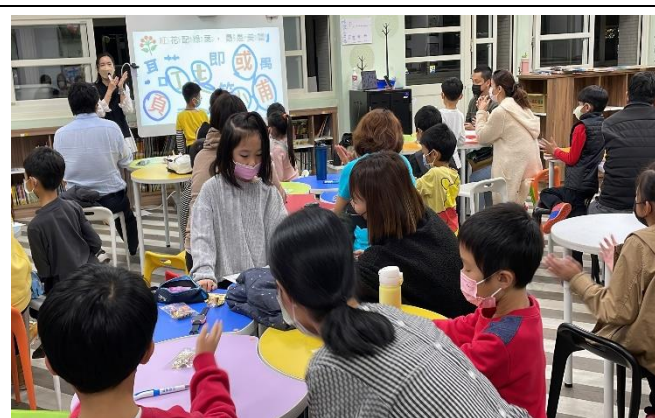
藉由語文遊戲搭起親子間情感交流的橋樑