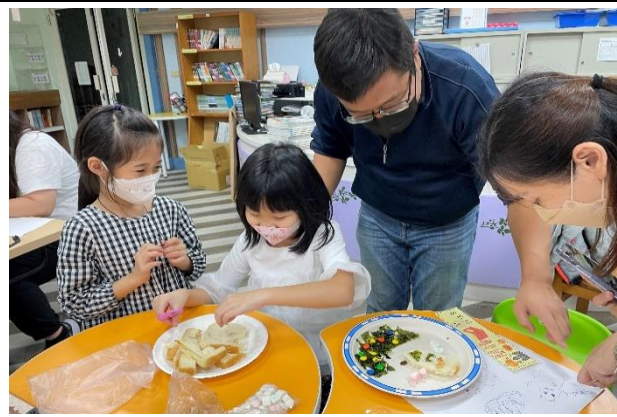
家長在旁協助指導，場面溫馨有趣。