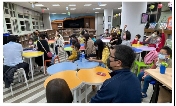
講師一開始選了一本『家家有本好聽的故事』，適時的幫助家長如何陪孩子輕鬆的閱讀。