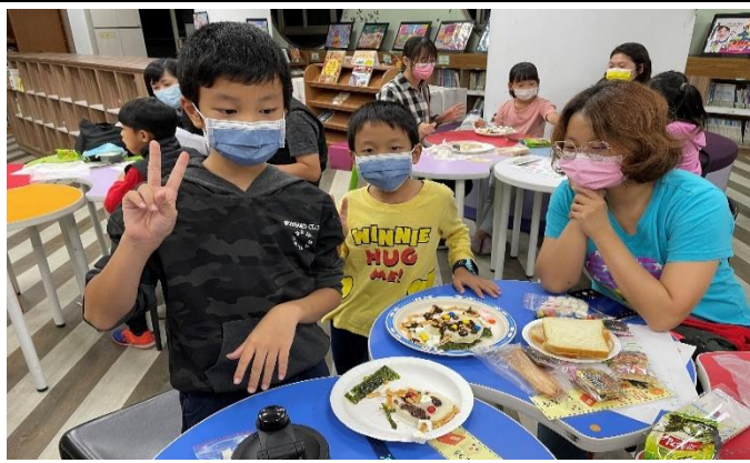
父母的愛與陪伴，是給孩子最好的禮物