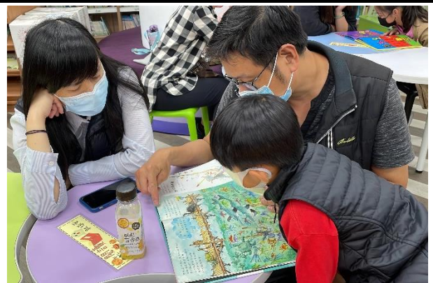
講師提供許多閱讀力的培養，適時舉出實例分享並確實舉列方法及步驟，讓家長受益不少。