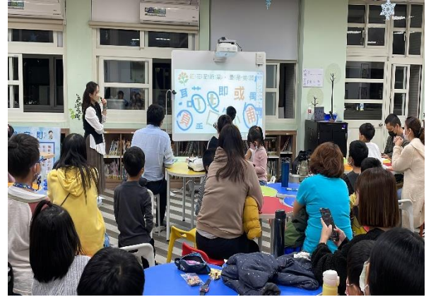
訓練孩子圖像思考的方法，引導陪伴的技巧等都很實用。