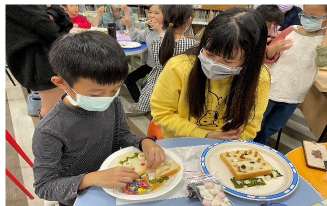
提升學生手作能力，讓每位同學都是愛家達人。