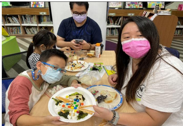
設計創意的餐點，且能凝聚家庭親子間向心力