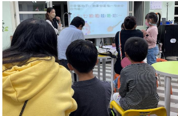
引導共同進行閱讀活動並彼此分享。