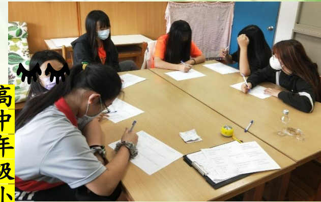
高 中 年 級 小 團 輔 學 習 照 片