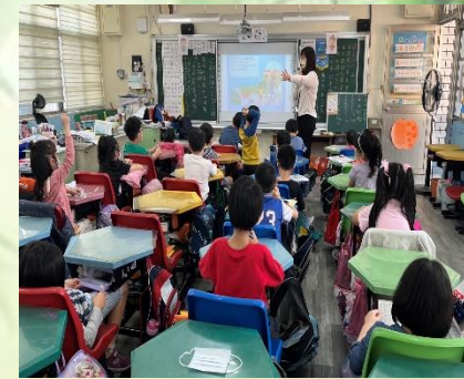
藉由繪本故事的問題討論