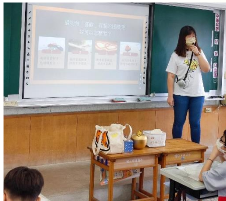
情感教育-合宜的表達好感