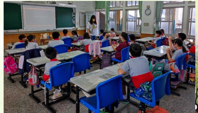
情境影片澄清概念