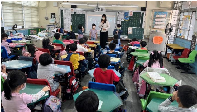
找學生討論演練故事的情境