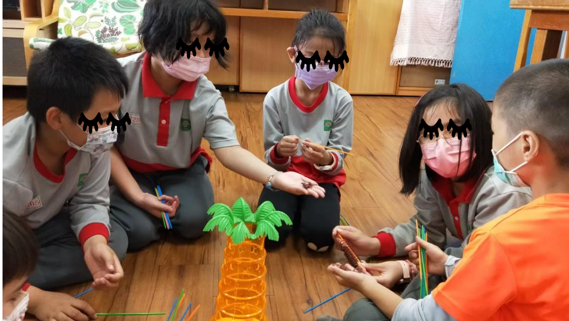
中年級小團輔學習照片

(三)開辦各式小團體輔導班、高關懷創客DIY班、桌遊人際互動班，陪伴孩 成長：設立獅子王信箱，從信件中篩選潛在個案，另開辦高關懷桌遊班、創客班， 提升學生自信及開發潛能，有效預防學生中輟！