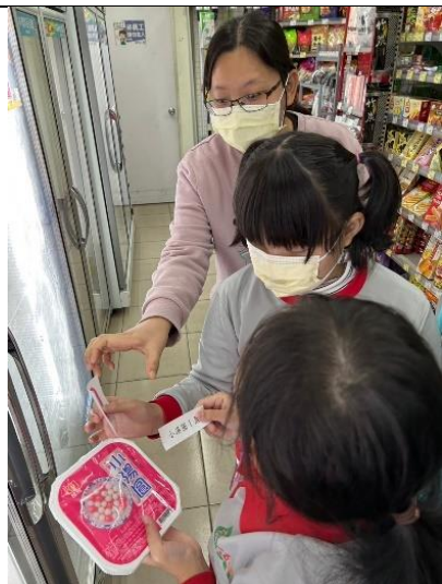
依據購物清單練習買湯圓