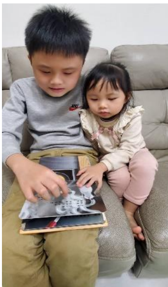
和妹妹一起閱讀課程教導過的相關繪本