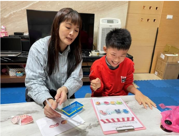
學習單：練習找出購物清單上的物品