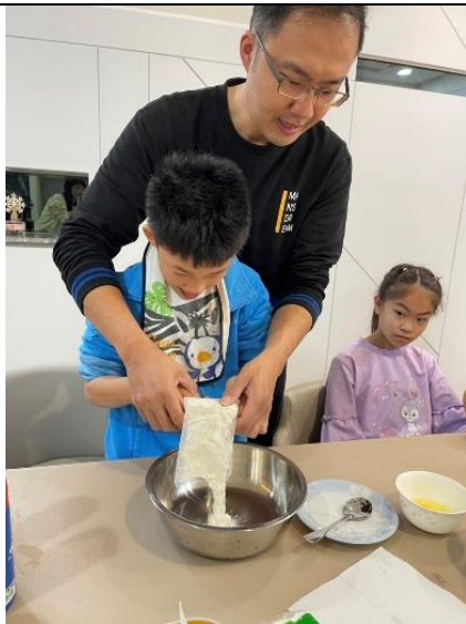
和家人一起做鬆餅