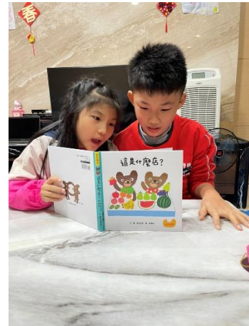
和妹妹一起閱讀課程教導過的相關繪本