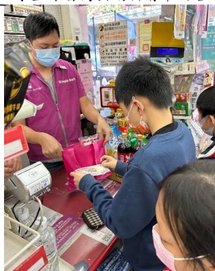
實際至商店進行購物活動