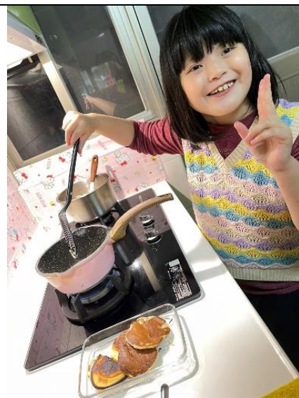
和家人一起做鬆餅