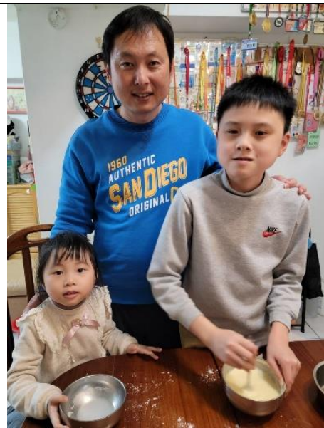
和家人一起做鬆餅