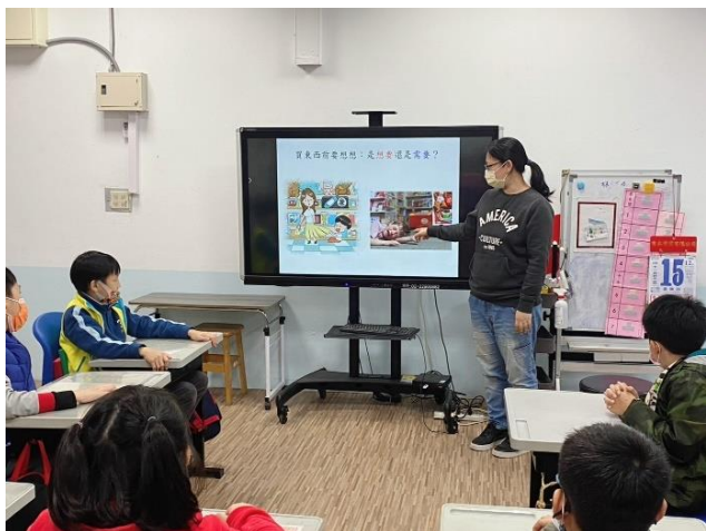
教導需要和想要的概念