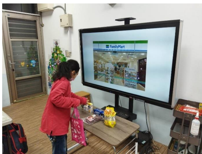
教室中模擬購物流程