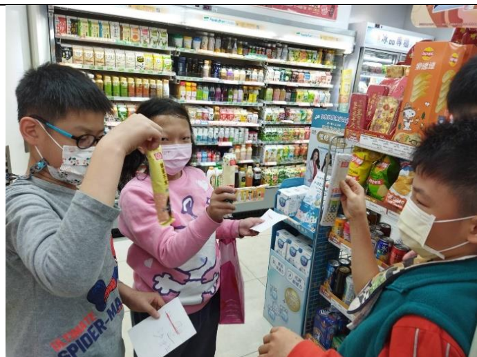
依據購物清單練習買做漢堡需要的沙拉醬