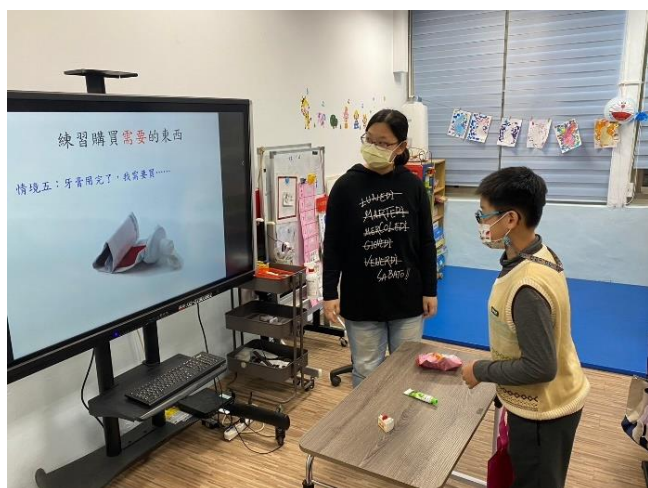
依情境問題讓學生從找出需要買的物品