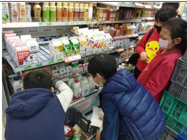
依據購物清單練習買做鬆餅需要的牛奶