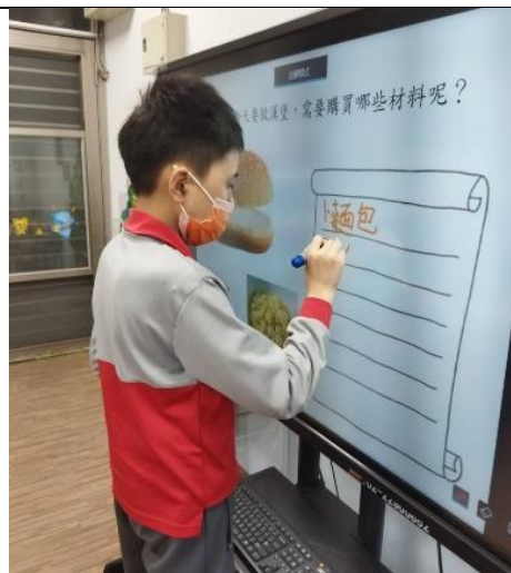
學生練習寫出購物清單內容