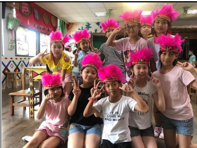
孩子們一眼瞧見原住民服飾，不約而同地發出『哇！好華麗喔』，大家爭相要體驗