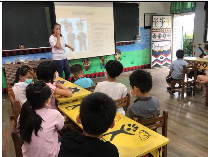
認識各族原住民文化特色及分布