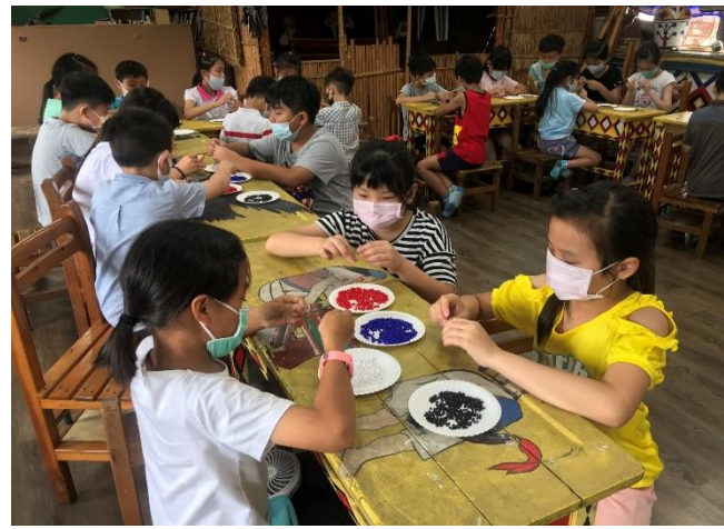
體驗原住民傳統技藝，毛編頭飾及專屬自己的串珠手環，孩子們愛不釋手。