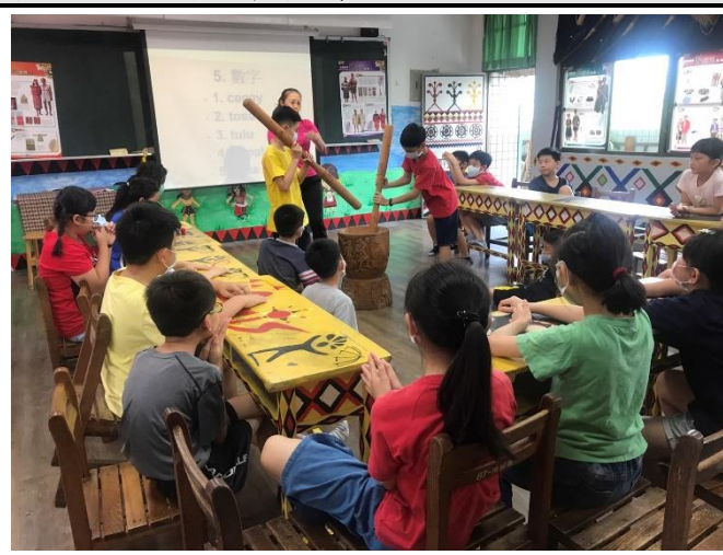
體驗搗米技藝，同學們各個躍躍欲試