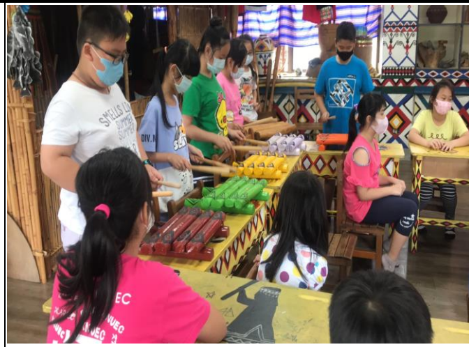
欣賞不同原住民族的音樂舞蹈特性，體驗敲擊木琴或跳豐年祭大會舞，他們使用器材完全取之於大自然