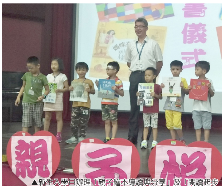
▲新生入學日辦理「親子繪本導讀與分享」及「閱讀起步