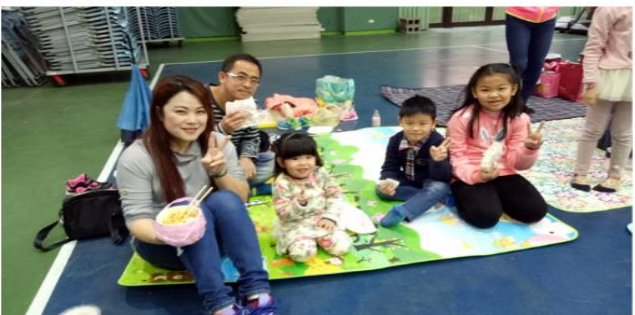
各自家庭自製餐點、自備野餐墊，一家老小一起來參與家庭親子的野餐體驗。