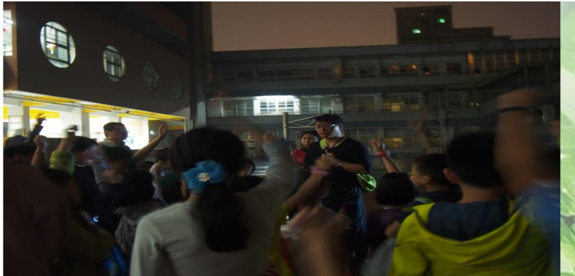
親子共作手抄紙 及校園夜遊