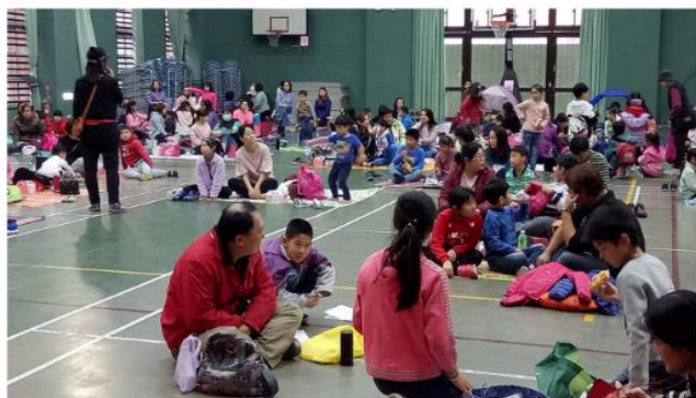
主持人介紹活動流程後，由小太陽原音舞蹈社小朋友開場帶領親子共舞。