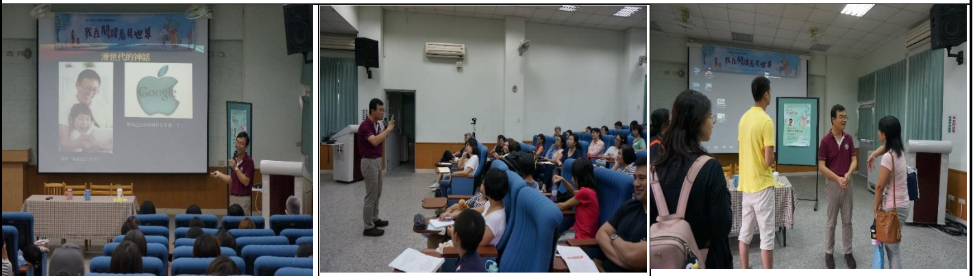
家長很有共鳴，結束還不捨離去