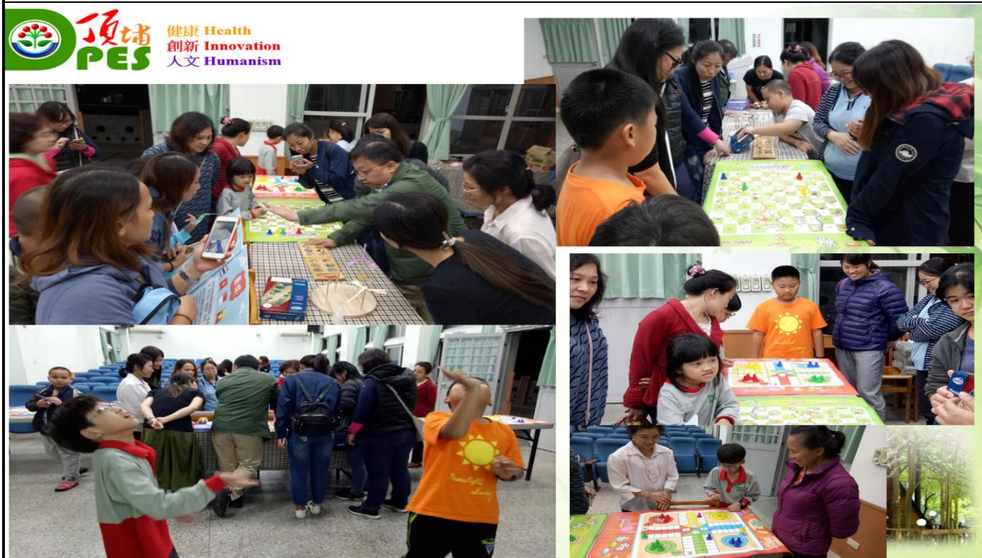
照片說明：家長一起共玩的遊戲、玩具、遊具，增進對於不同個體的尊重、接受度