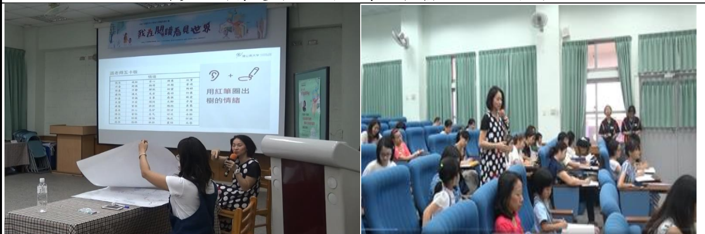
玩卡片學會辨識情緒、讀卡片學會閱讀與表達，豐富了孩子腦中的表達辭彙庫。