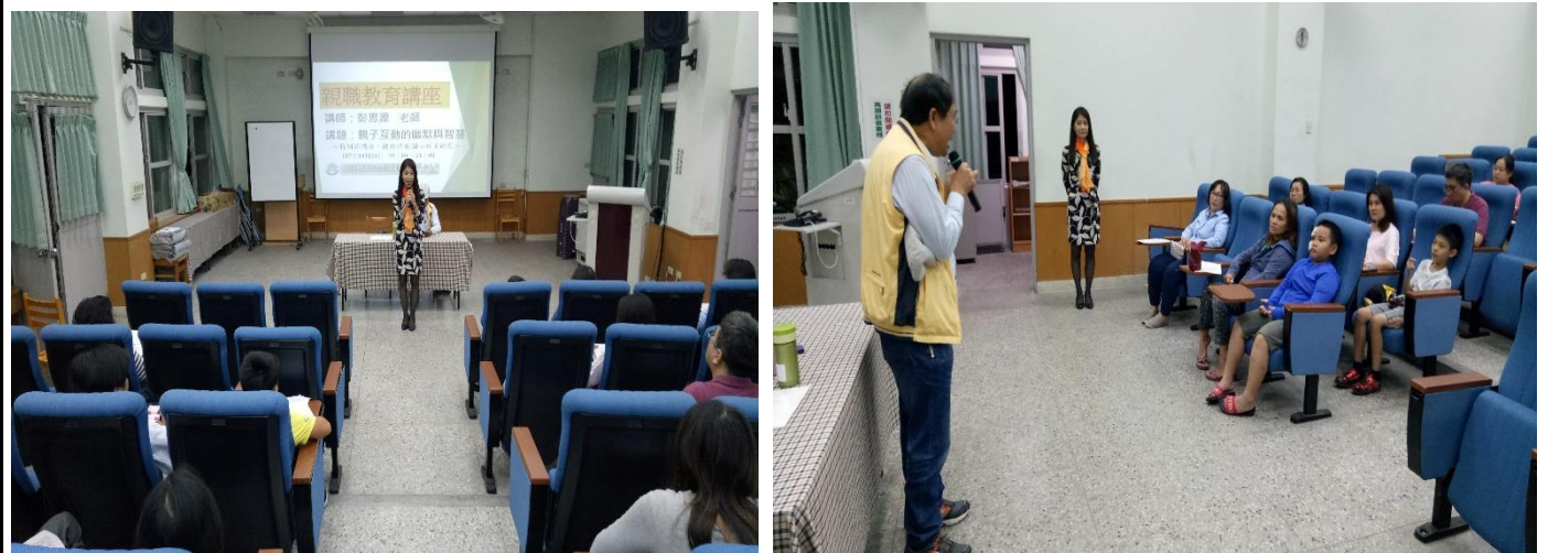
家長陸續簽到，校長開場後，講師選取實例、故事來分享