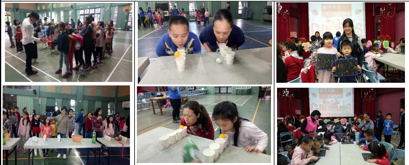
小太陽大會舞表演及親子共作-刮畫創作