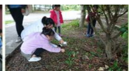
在輕鬆自在的氛圍中，親子一同品嚐美食，體驗好多有趣的活動，享受簡簡單單，屬於家人親友的美好時光。