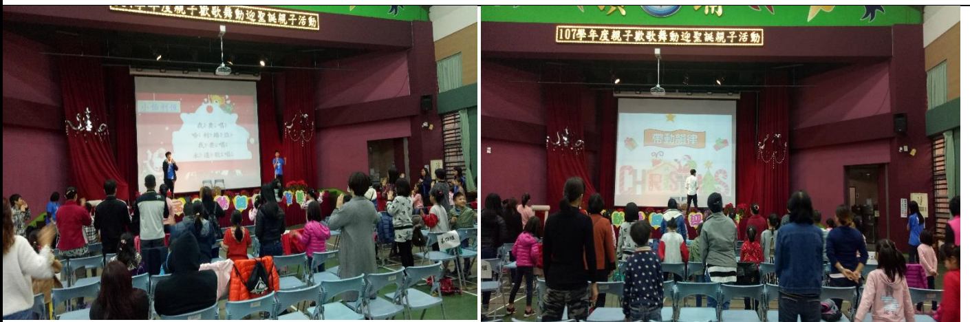
家長陸續簽到，歡迎 歡唱. 破冰. 親子同樂. 遊戲