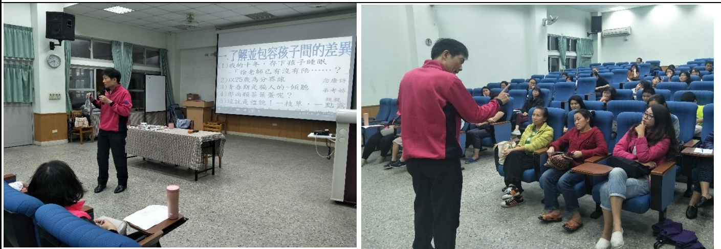
家長陸續簽到，校長開場後，講師選取實例、故事來分享