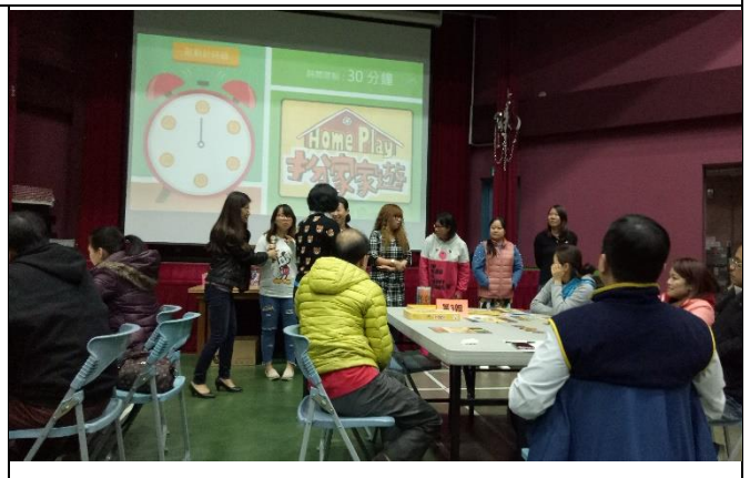
照片活動：實際操作遊戲，你來我往的進行著，過程熱鬧無比。