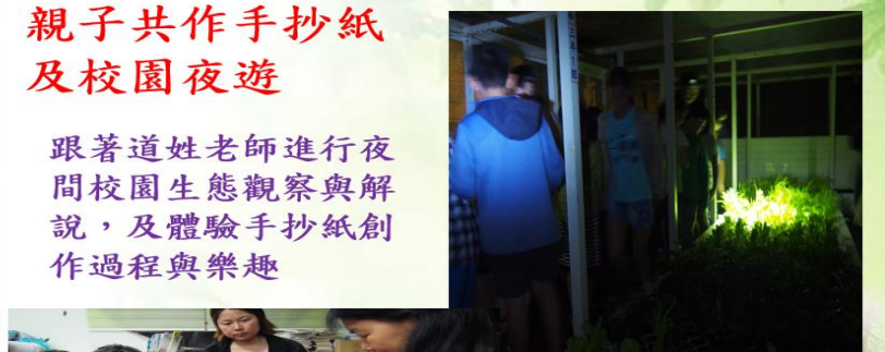
跟著道姓老師進行夜間校園生態觀察與解說，及體驗手抄紙創作過程與樂趣