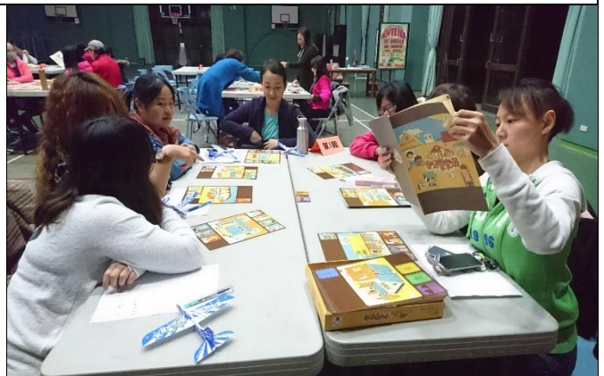
照片活動：家長分享參與桌上遊戲的心得，也對於能參與此次課程感到相當的開心。