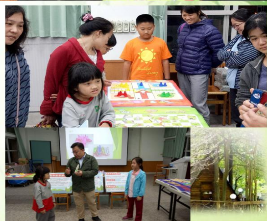
照片說明：講師帶來各種融合遊戲與玩具讓大家親手體驗，體現全民共玩之理念。