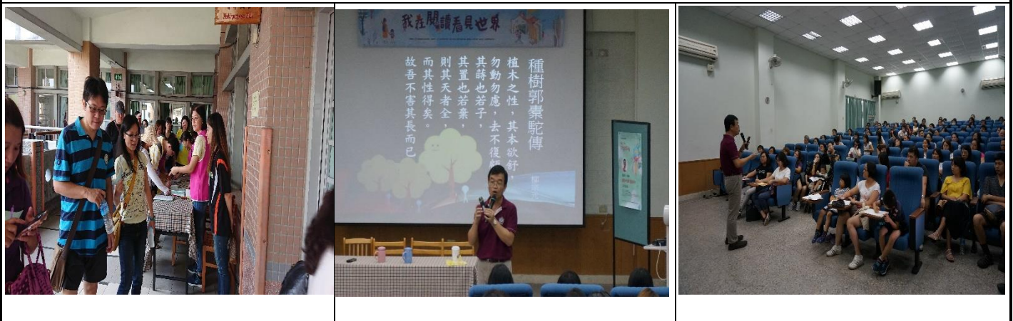
家長陸續簽到，校長開場後，講師選取實例、故事來分享