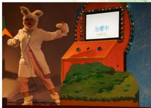
羅主任開場，學生熱烈歡迎，精湛的演出技巧，帶給小孩不同的啟發