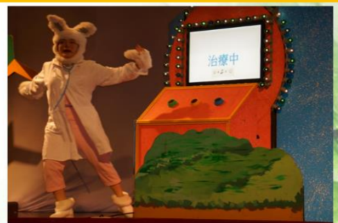
羅主任開場，學生熱烈歡迎，精湛的演出技巧，帶給小孩不同的啟發