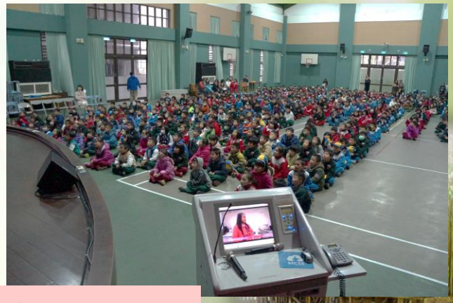
107 學年 兩公約宣導照片