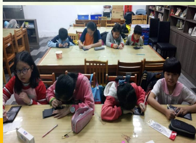
夜光天使多元學習課程