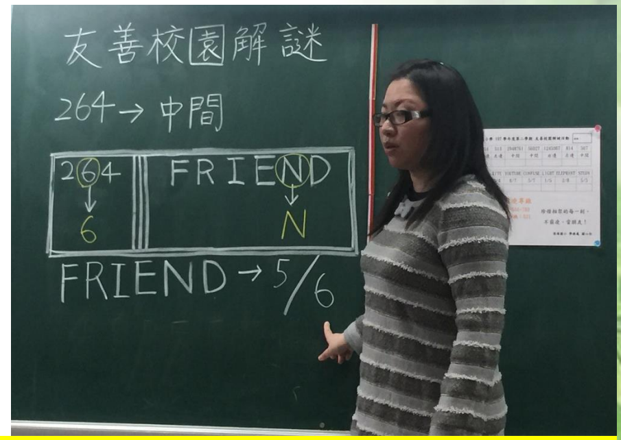
友善校園解謎-教師說明友善校園解謎活動，讓各組討論進行解謎。