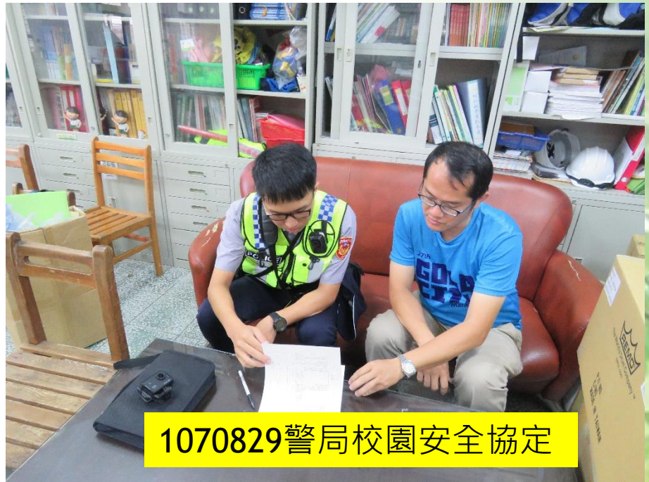
1070829 警局校園安全協定