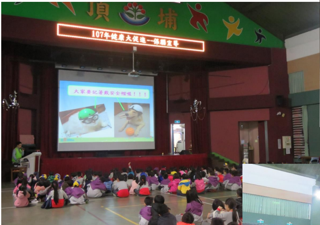
1071025交通安全宣導(脊隨傷害協會)