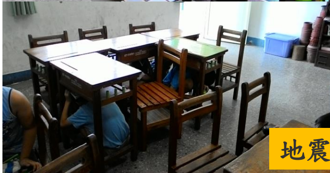
地震避難趴下掩護穩住