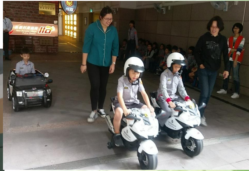
1071018新板村派出所體驗