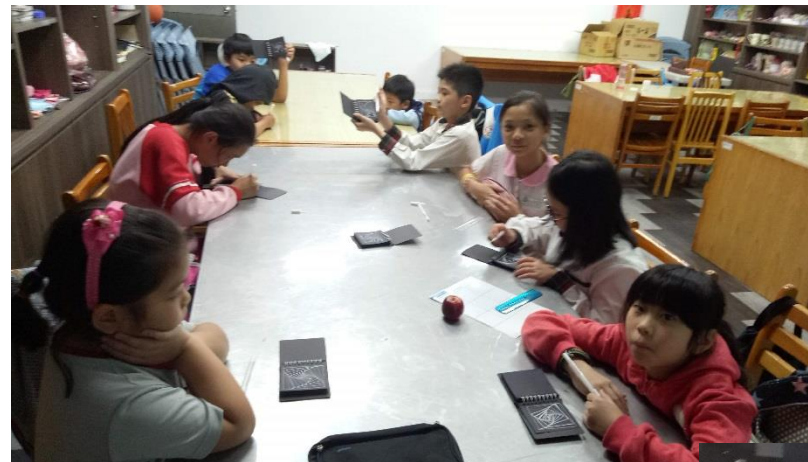
夜晚寂靜的校園增添另一幕活力