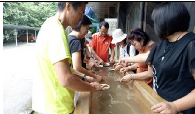
活動說明：體驗淘金術