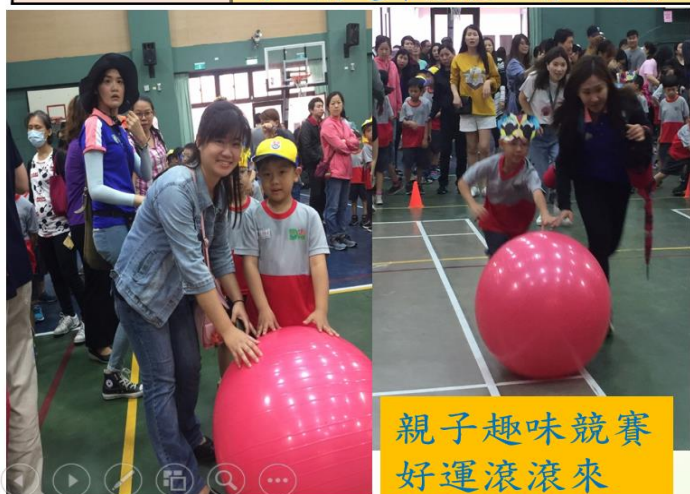
親子趣味競賽 好運滾滾來