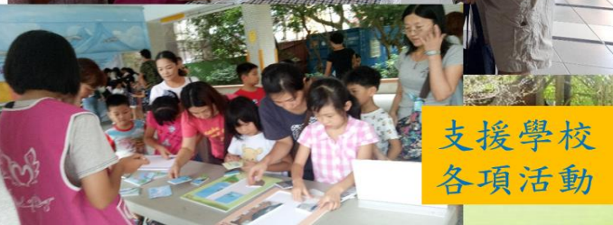
支援學校 各項活動