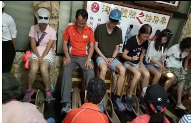
活動說明：體驗淘金搓搓樂與踏踏樂