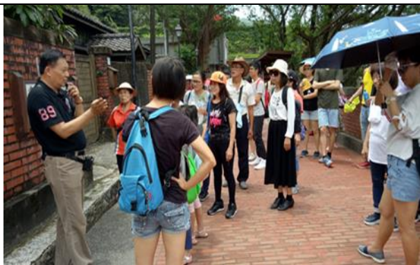
活動說明：介紹金瓜石的人文與自然生態