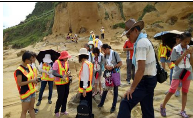
活動說明：海岸有奇形怪狀的岩石，令人讚嘆。