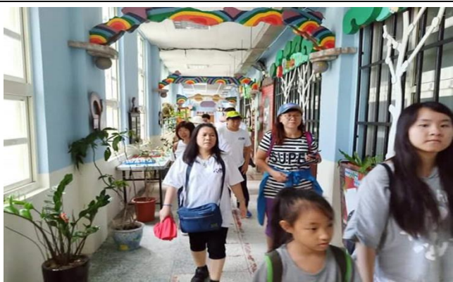
活動說明：參觀瓜山國小鐵軌走廊