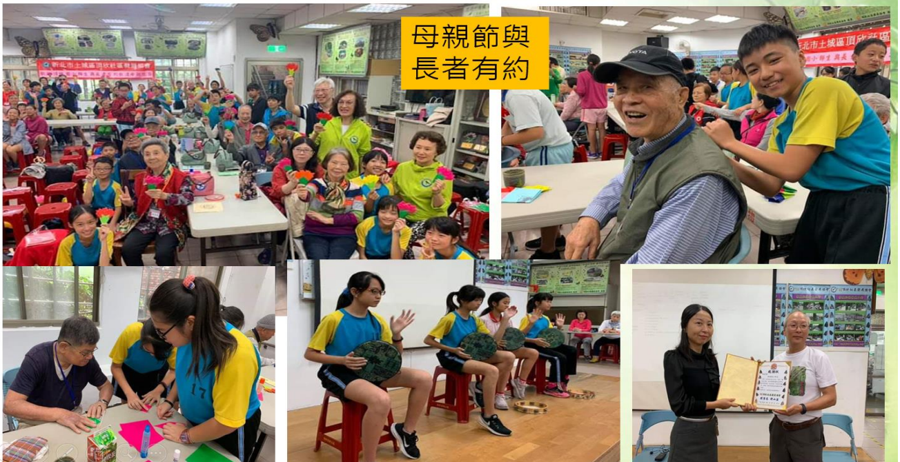
母親節與長者有約