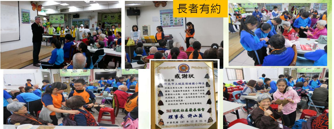
聖誕節與長者有約