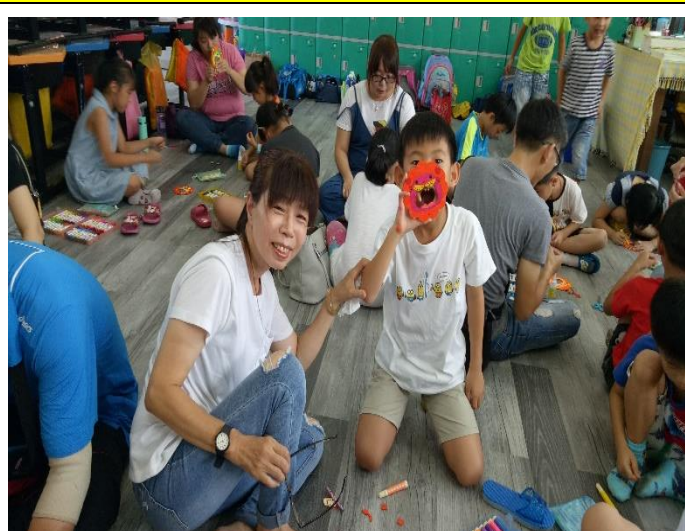
體會和家人在一起做活動時的溫暖感受