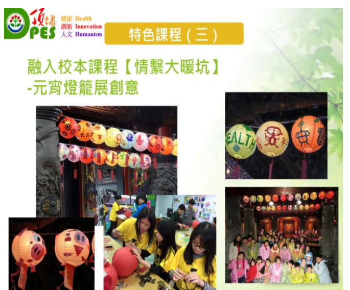
與祖師要合作辦理關懷社區・元宵節彩繪親子燈籠比賽活動