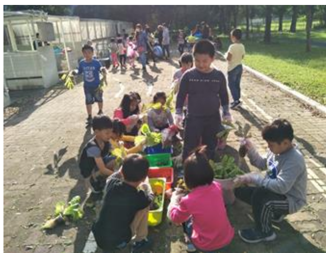
與家人一起規畫親子間的活動