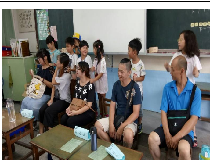
母親節安排家長入班讓孩子盡盡孝心，表達感謝對父母的愛