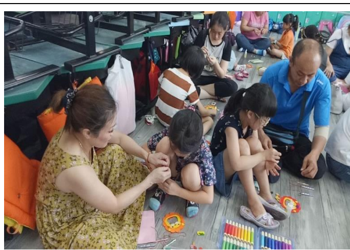
家長日邀請家長到班級進行大手牽小手活動，讓學生了解家人的付出以及關心