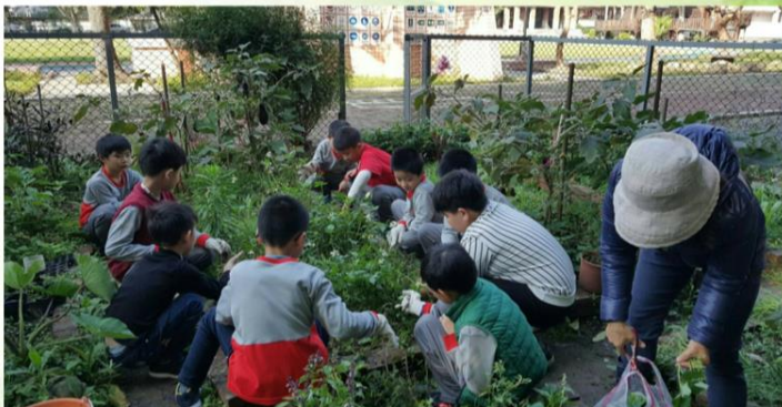
學習日常生活能力