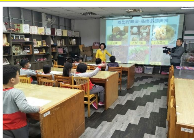
孩子都能站在客觀的角度去尊重和包容不同的文化。