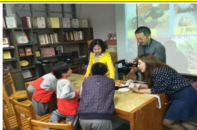
多數孩子面對不一樣的異國美食文化，且接受度高