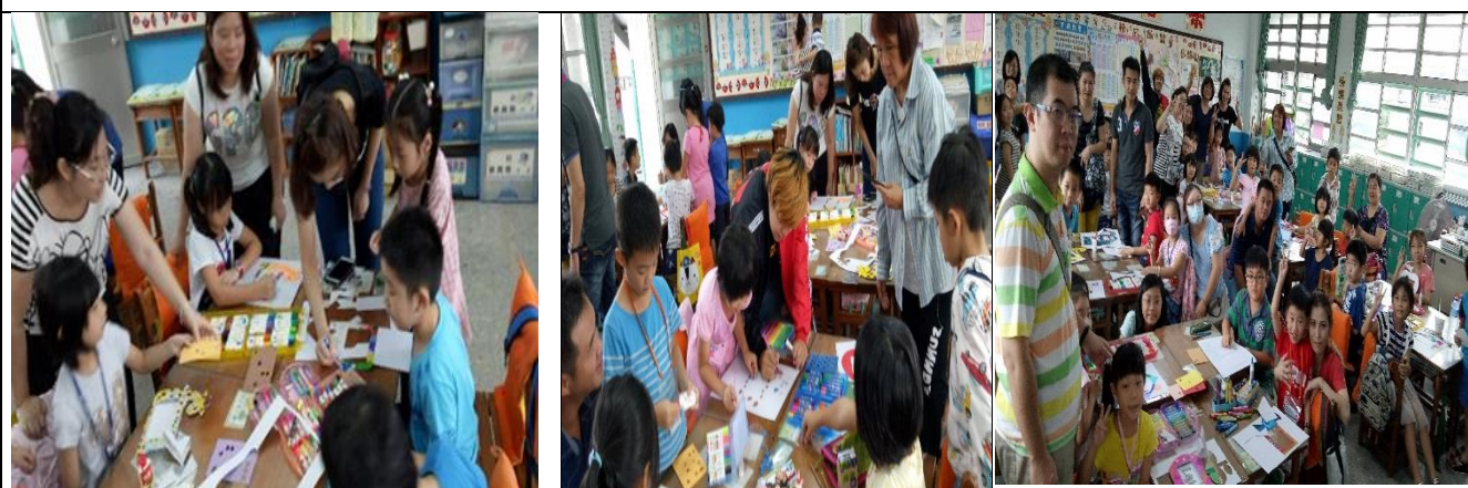
家長日當天，教師以相框設計的 PPT 教學，過程中親子一起合作動動手，黏好四片相框邊條並裝飾相框。