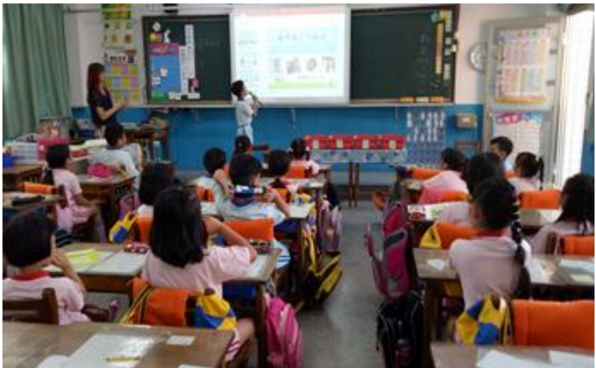
藉由『我的媽媽真麻煩』繪本，認識家人的特色與喜好